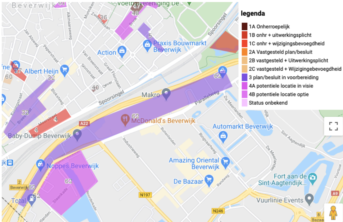
Afbeelding 1. Uitsnede Plancapaciteit Noord-Holland met daarin de Parallelweg en Kop van de Haven.